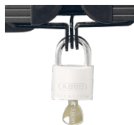
Halterungen und Flügelschloss