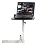
Schwenkarm für Notebooks